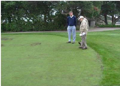
Dunes Course 18번 홀 옆 연습그린에서 시험 중. 나무 사이로 살짝 보이는 그늘집 앞에 18번 그린 전체에 내년 봄 시험 방제할 계획

약제처리는 2010년 4월부터 1개월 간격으로 9월까지 포아박사를 여러 약량을 최대 5회까지 연속처리 하였는데 특히, 저약량은 전혀 약해 없이 효과도 눈에 띄었다. 저약량 연속처리는 안전도 면이나 효과 면에서 가장 추천할 만 하였다.